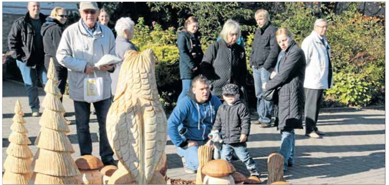
Gut besucht ist am Wochenende der Herbstmarkt im Kloster Grauhof: Während die meisten Händler ihre Stände im Gebäude haben, präsentiert ein Holzschneider seine Werke im Garten des Klosters.