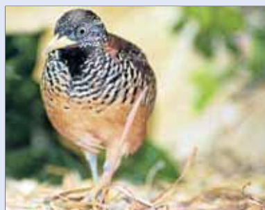
Das weibliche Bindenlaufhühnchen weiß, was es will.

Frauen machen sich gerne mal schick: Sie ziehen bunte Kleider an und frisieren sich die Haare. Bei Tieren ist es oft eher anders herum. Da sind die Männer die Schönlinge, damit sie die Frauen beeindrucken können. Die Weibchen müssen nur den Nachwuchs zur Welt bringen und sich dann